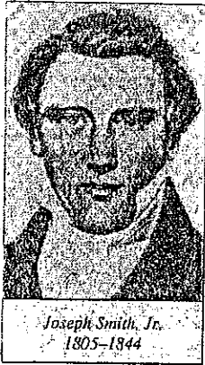
Joseph Smith, Jr. 1805-1844